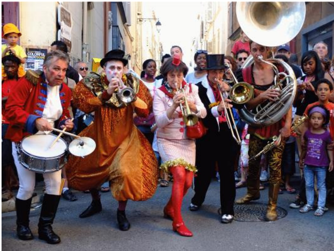
Fête du Panier : Marseille 2012